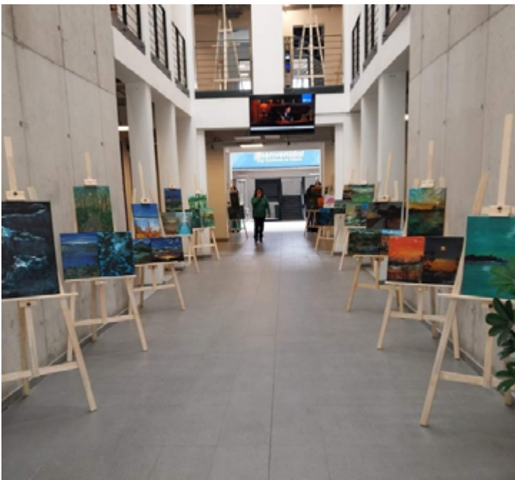
Leyenda: Exposición de Robinson Angulo en Biblioteca Iplacex sede Santiago.